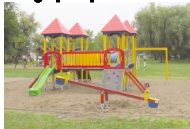
Befejeződött a Bujtosi városligetben, illetve az Alma utcán található játszóterek rekonstrukciója

A napokban elkészült a Bujtosi városligetben a játszótér felújítása és számos újdonság is várja az ide érkező csoppségeket. A NYÍRVV Nonprofit Kft. munkatársai kihelyeztek egy négytornyú, többfunkciós várat a kisebbek nagy örömeire. Ezen kívül új mérleghintával, valamint a gyermekek egyensúlyérzékét fejlesztő faragott kígyó játékkal is bővült a szabadidőpark. A ligetben szabadtéri kondieszközöket is felállítottak a sportolni vágyóknak. Az Alma utcán egy új háromtornyú várral bővült a játszótér, mely a korábbi, balesetveszélyessé vált játékot váltotta fel. 2013-ban a NYÍRVV Nonprofit Kft. több mint 45 millió forintot fordít a település játszótéereire.