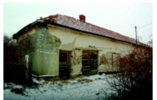
A régi iskola – itt volt a fórum