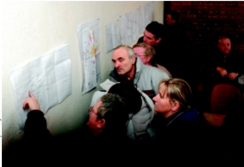
A terveken mindenki megtalálta a maga ingatlanát és a csatlakozási pontot

A zártkerttel együtt közel ezer lakosa van Nagyszállásnak. A fiataloknak semmilyen szórakozási lehetőségük nincs. Szombaton délután háromkor jön az utolsó busz. Ha egy fiatal pár be akar menni a városba, moziba, diszkóba, nem tud hazajönni, ha nincs kocsija. Taxival egy vagyon, a városhatár-tábla miatt a viteldíj jóval magasabb. Sorolják a panaszaikat az itt lakók: a legkisebb, legeldugottabb megyei faluban is van Internet. Nagyszálláson egyáltalán nincs. Telefon ugyan van a lakásokban, de utcai telefonfülke nincs. Egyszer csak felemelték egy daruval és elvitték. Nincs postahivatal. Nincs orvosi rendelő. Be kell menni a városba gyógyszer felírtnia, a 80–90 évesek nem tudnak a buszra felülni. Azért is kérdezem, hová tartozunk mi?