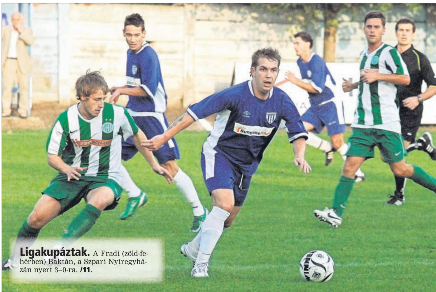
Ligakupáztak. A Fradi (zöld-fehérben) Baktán, a Szpári Nyíregyházán nyert 3-0-ra. /11.

Összesen kétszáz kilométernyi új csatornát fektetnek le, és nyolcezer új bekötési pontot is kiépítenek.