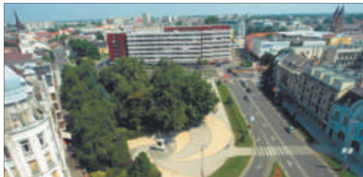
Lesz ott valaha mélygarázs?

„Tisztelt honfitársam! Nem akarok feltételezni semmit levelem megírásával, annak tartalmával kapcsolatosan. De nincs annál nagyobb öröm, mint valakit felvilágosítani arról, amit nem tud. Talán azt is tudja, hogy ha nem tudunk valamit, akkor kérdezzünk. Ön ezt a kérdést