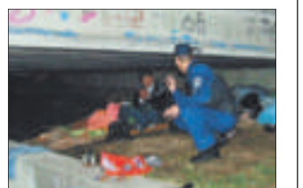
Fedél nélkül

A fedél nélkül éjszakai embereket megpróbálták rábeszélteni, hogy az egyre hidegebb időben saját érdekükben inkább a hajléktalanszállókra aludjanak – nem sok sikerrel.