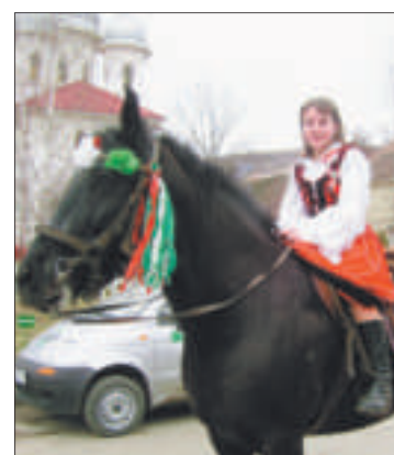
Az egyik új kapcsolat: Székelykeresztúr Berde Mózes Gimnázium (Fotó: amatőr)

tavasszal, s nyáron Franciaországba, Finnországba, jövő szeptemberben pedig Németországba utaznak a diákok. A gimnázium célja, hogy a nyelvtanuló diákok a célnyelvi országban fejleszthessék, és készség szinten elsajátítsák nyelvtudásukat.