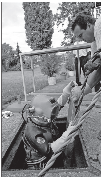
A szennyvízelvezető továbbra is álom Kisteleki szőlőben

elmondta: a Közbeszerzési Döntőbizottság tárgyalása után szeptemberben kezdődhet el a munka, ám ha a nyertes cég pályázatát érvénytelennek nyilvánítják, új közbeszerzési eljárást kell indítani – ez pedig újabb három hónapos késést jelent.