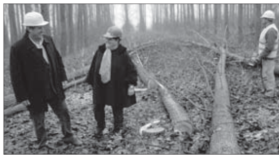
Tisztul a terület

Nyíregyháza (KM) – Megkezdődött a munkaterület előkészítés a felújításra váró II. számú szennyvíztisztító telepen. A Nyíregyháza és Térsége Szennyvízelvezetési és Szennyvíztisztítási Nagyprojektjének részeként, december elején, a szennyvíztisztító telep területén – a munkaterület előkészítésének első elemeként – kitermelték az építkezések útjában álló fákat. A beruházási terület előkészítése várhatóan jövő tavaszig befejeződik.