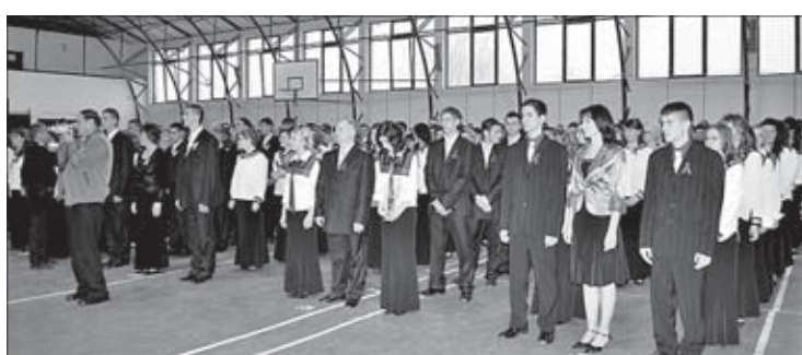
Megtették az első lépést