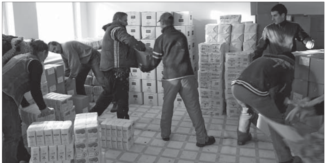
Megérkeztek a csomagok

A leveleket az élvezhetőbb olvashatóság érdekében általában rövidítjük, az azonos mondanójúakat összevesszük. Az oldalt civil vélemények számára tartjuk fenn, politikusok leveleit csak abban az esetben közöljük, ha személy szerint szólították meg őket, és erre kívánnak válaszolni. Ha olvasóink közül valaki nem ért egyet egy itt megjelent levél tartalmával, természetesen válaszolhat a levélíróknak. Az olvasói oldalon továbbra is csak a teljes névvel és címmel érkező, telefonszámmal is ellátott, így telefonon leellenőrizhető, valós feladóval rendelkező leveleket közöljük.