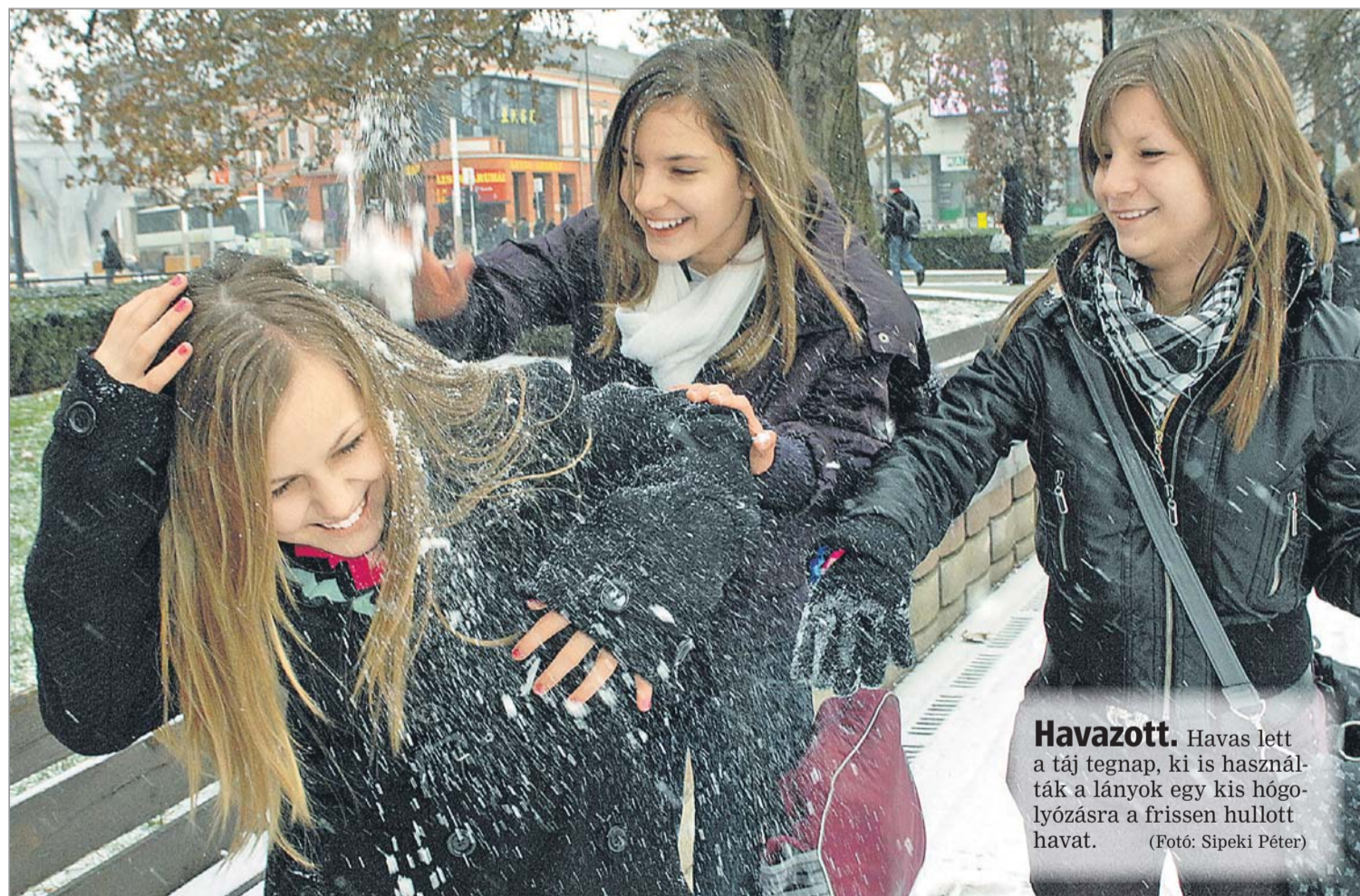
Havazott. Havas lett a táj tegnap, ki is használták a lányok egy kis hógyűlésre a frissen hullott havat.

lat díja a járművek kategóriájától függően 17 ezer és 20 ezer forint között mozog. Ezzel párhuzamosan az eredetiségvizsgálatokat végző vállalkozások munkatársai pén- teken utcai tüntetésre készülnek amiatt, hogy az új szabályozás miatt az állam felbontotta a velük 2011-ig még érvényes szerződést.