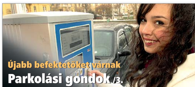
Újabb befektetőket várnak Parkolási gondok /3.