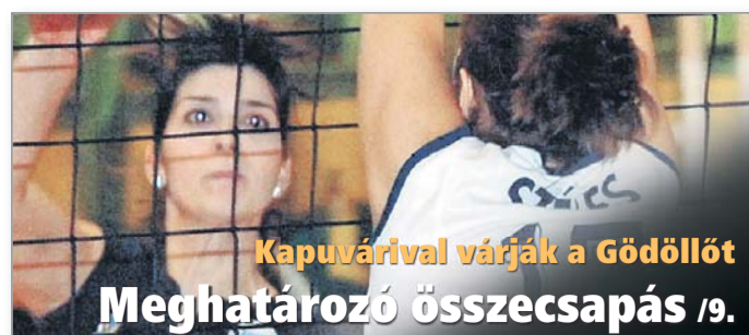
Kapuvárral várják a Gödöllőt Meghatározó összecsapás /9.