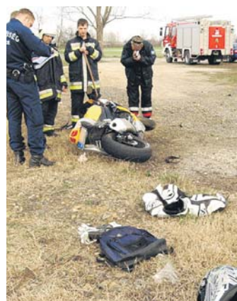
A motorost kórházba vitték