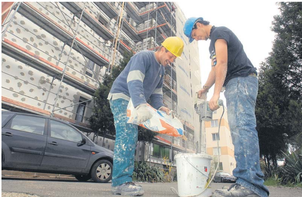
A felújítás drága dolog, sokan számolják, mi mennyi és megéri-e?

- Akinek most több százezer forintot kell kifizetnie, annak hátrány a felújítás. Persze, szebb, modernebb és korsze-