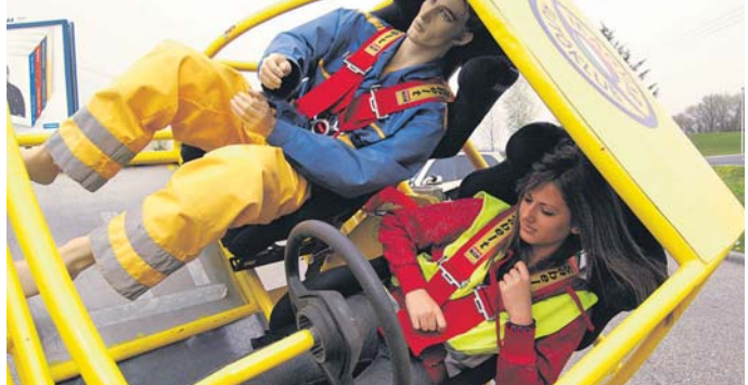
Ez a borulás garantáltan biztonságos volt, de nem ért felkészülni az ilyen esetek megelőzésére

balesetektől, ugyanis többségük már önállóan vesz részt a közlekedésben. /3. SZON-PS