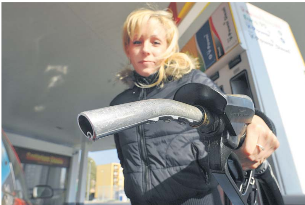
Ami a csövön kifér – egyre többen nézik a kutak ártáblázatát

Retro-érzése volt kedden Csengerben a járőrelőknek. A település benzinkútjára ugyanis kannákat is vittek magukkal a gépjárművet megtankolni szándékozók – mint ahogyan egykoron tettük a szocializmus idején,