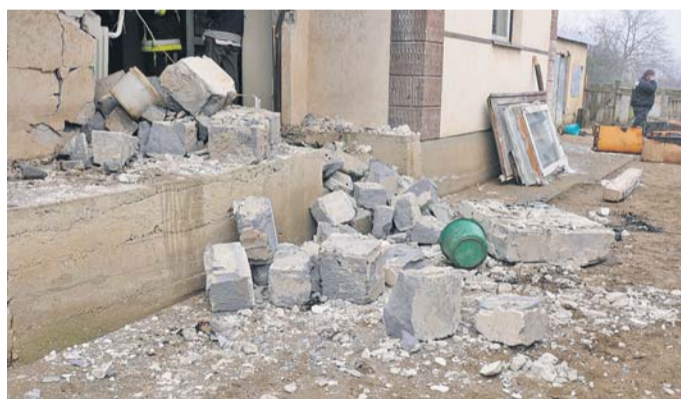
A ház romjai az udvaron