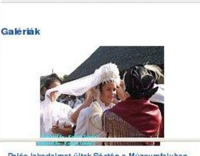
Palóc lakodalmat ülték Sóstón a Múzeumfaluban