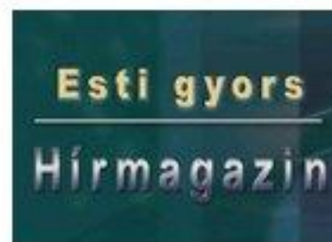
Esti Gyors 2009.10.06. 2.rész