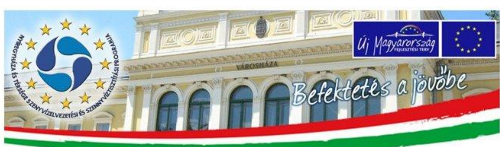
A Nyíregyháza és Térsége Szennyvízelvezetési és Szennyvíztisztítási Program

Nyíregyháza Megyei Jogú Város Közgyűlése, kihasználva az európai uniós csatlakozás kínálta lehetőségeket, 2003. decemberében határozatot hozott arról, hogy pályázatot nyújt be az Európai Unió Kohéziós Alapjához Nyíregyháza és térsége szennyvízelvezetési és szennyvíztisztítási programjának megvalósítására.